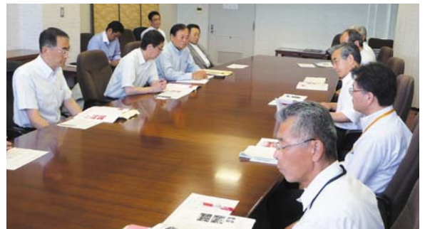
視察先で自治体の責任者と懇談