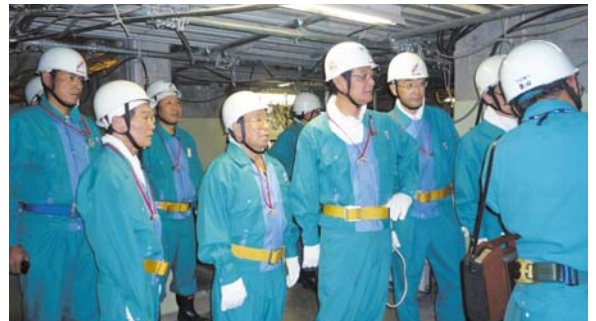
原子力発電所を視察