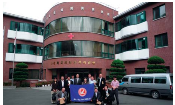
現在の原爆被害者福祉会館

大韓赤十字社、大韓赤十字社原爆被害者福祉会館、韓国原爆被害者協会を、毎年訪問する中で韓国被爆者との意見交換を行うとともに被爆者救援カンパ金から医療器具および活動支援金を贈呈し、交流をしています。