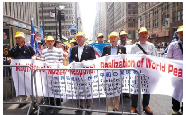
2010年5月ニューヨークでの核兵器廃絶のデモ行進