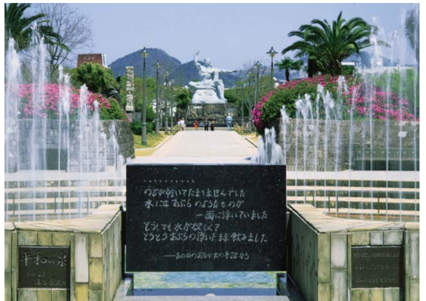
後方は平和祈念像