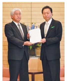
鳩山首相に署名簿提出