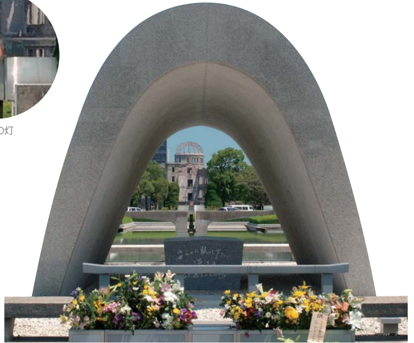
手前が慰霊碑、中央が「平和の灯」、後方は原爆ドーム（世界遺産）

この「平和の灯」は、広島にねむる20数万の被爆者の霊を慰めるとともに、核兵器廃絶の日まで燃え続けます。