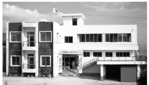
1973年、核禁会議が寄贈した韓国原爆被害者診療センター